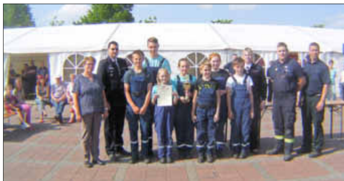
1. Platz Jugendfeuerwehr Tarnow