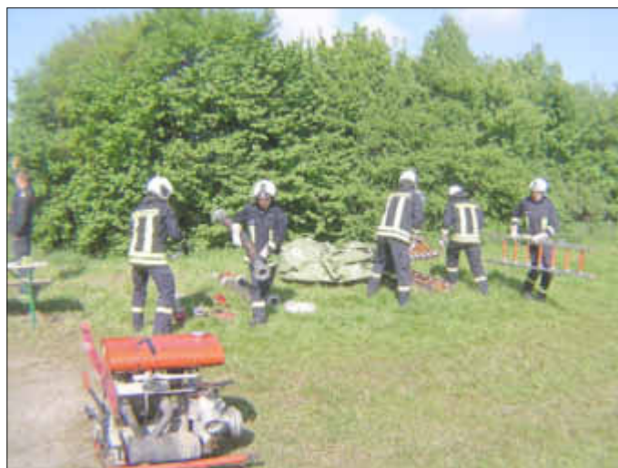
Aufbau eines provisorischen Beckens