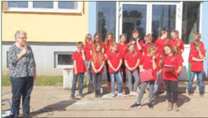
Eröffnung der Preisverleihung