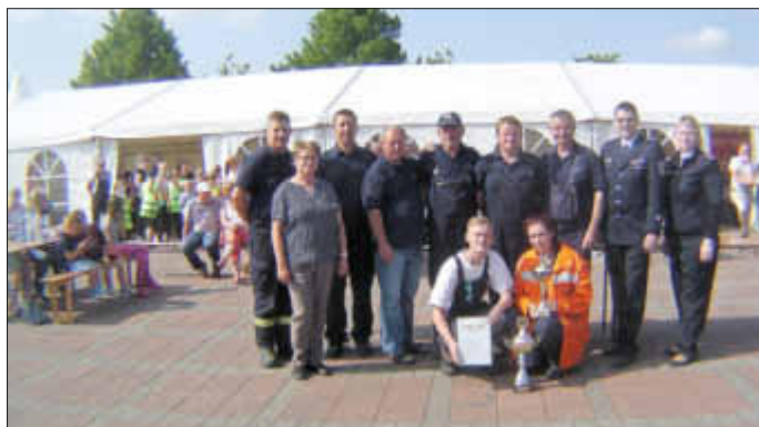
1. Platz FFW Lüssow-Karow)