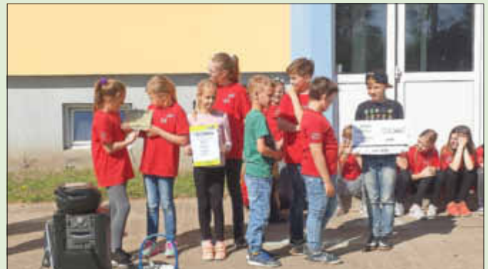
Schülervertreter mit dem Preis