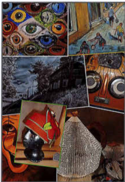
Alte Schmiede - Groß Tessin